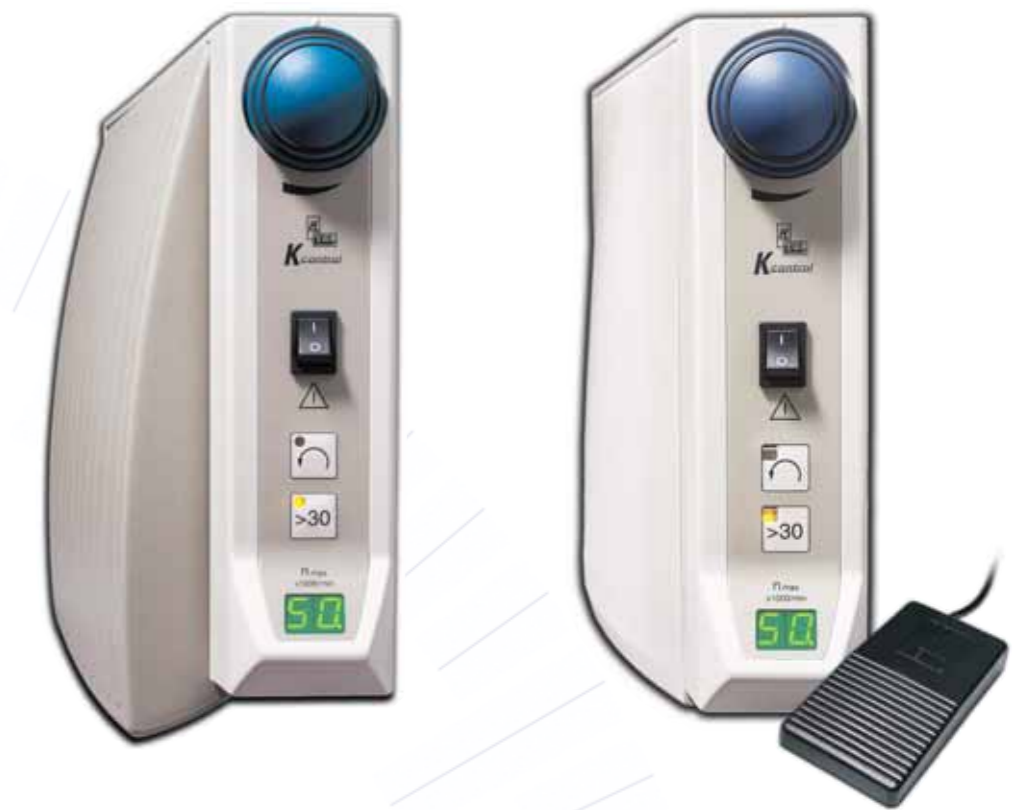
Das Steuergerät für Ihre KaVo K-POWERgrip: die K-Control. Wählen Sie zwischen den drei praktischen Versionen Tisch-, Knie- und Fußsteuergerät.

Nur ein Steuergerät für fast alle KaVo Handstücke. Auch deshalb ist die K-Control mit Sicherheit eine gute Investition.