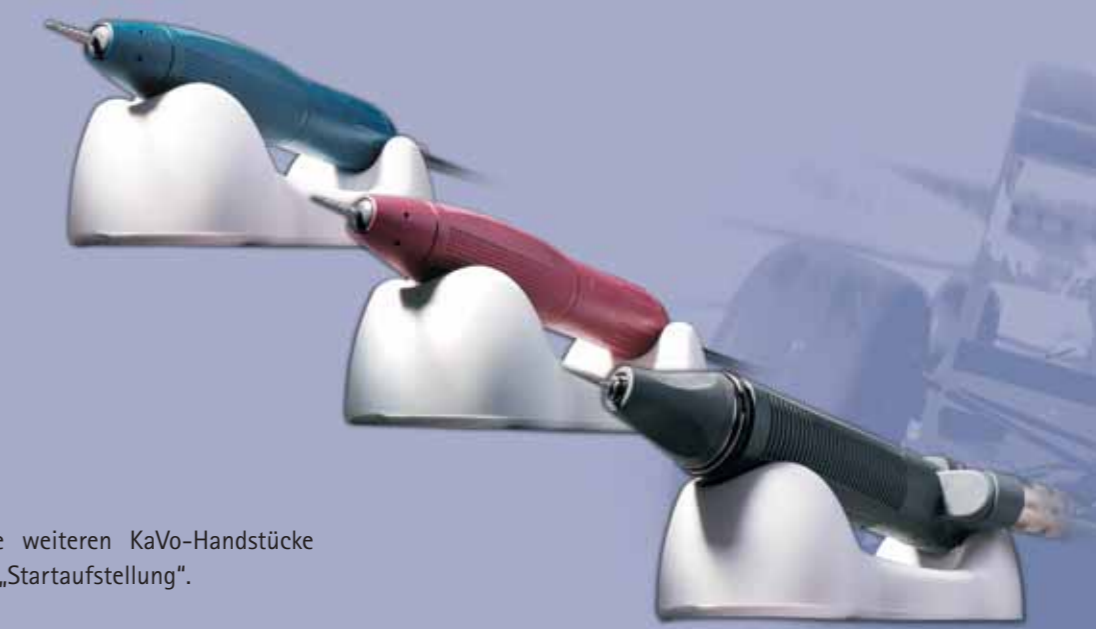
Die weiteren KaVo-Handstücke in „Startaufstellung“.