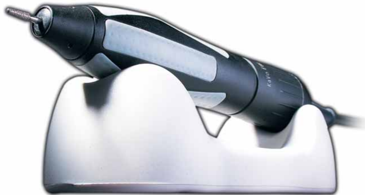
Sieht nicht nur gut aus, sondern ist auch mit einem Griff einsatzbereit: die K-POWERgrip in der platzsparenden Handstückablage.